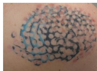
Après 1 séance